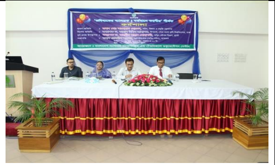
‘ভবিষ্যতের ব্যাপডক : বর্তমানে করণীয়’ শীর্ষক কর্মশালা

ব্যাপডকের সেবা/কার্যক্রমসমূহ বহুল প্রচারের লক্ষ্যে দেশের বিভিন্ন সরকারি বিশ্ববিদ্যালয়, মেডিক্যাল কলেজ এবং বিভিন্ন গবেষণা প্রতিষ্ঠানে ১২ টি সেমিনার/ কর্মশালা/ অবহিতকরণ সভা অনুষ্ঠিত হয়েছে।