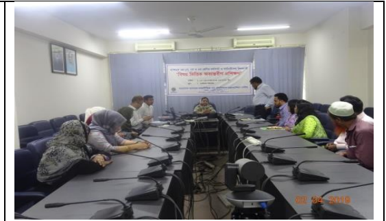
বিষয়ভিত্তিক অভ্যন্তরীণ প্রশিক্ষণ

কর্মকর্তা/কর্মচারীদের দক্ষতা বৃদ্ধির জন্য প্রত্যেককে ৬০ জনঘন্টা বিষয় ভিত্তিক প্রশিক্ষণ প্রদান করা হয়েছে।