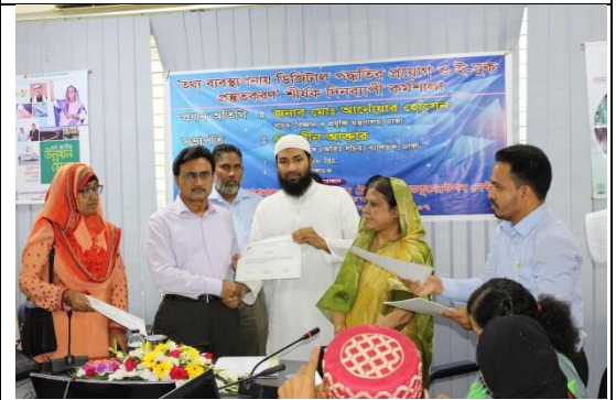
ই-বুক প্রস্তুতকরণ প্রশিক্ষণ

তথ্য ব্যবস্থাপনায় ডিজিটাল পদ্ধতি প্রয়োগের অংশ হিসেবে দেশের বিভিন্ন আরএন্ডডি প্রতিষ্ঠান ও বিশ্ববিদ্যালয়সমূহের গ্রন্থাগারিক ও গ্রন্থাগার সংশ্লিষ্ট কর্মকর্তাদের অংশগ্রহণে ০৩টি ই-বুক প্রস্তুতকরণ প্রশিক্ষণ অনুষ্ঠিত হয়েছে।