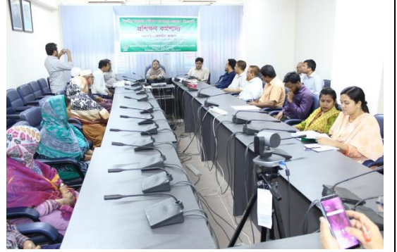
জাতীয় শুদ্ধাচার কৌশল বাস্তবায়ন সংক্রান্ত কর্মশালা

ব্যান্ডকের আবশ্যিক কৌশলগত উদ্দেশ্যসমূহ বাস্তবায়নের লক্ষ্যে নৈতিকতা কমিটির সভা, শুদ্ধাচার সংক্রান্ত প্রশিক্ষণ/কর্মশালা এবং অংশীজনের অংশগ্রহণে বেশ কয়েকটি সভা অনুষ্ঠিত হয়েছে।