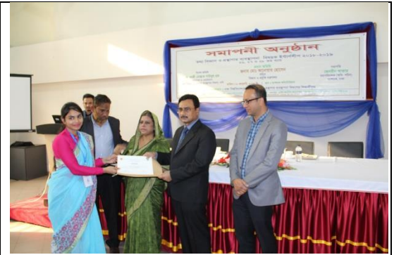
ইন্টার্নশীপ কোর্স সমাপনী অনুষ্ঠান

২০১৮-২০১৯ অর্থ বছরে ব্যাপডক কর্তৃক ঢাকা বিশ্ববিদ্যালয় ও রাজশাহী বিশ্ববিদ্যালয়ের তথ্য বিজ্ঞান ও গ্রন্থাগার ব্যবস্থাপনা বিভাগে অধ্যয়নরত ছাত্র-ছাত্রীদের অংশগ্রহণে ৫টি ব্যাচের ইন্টার্নশীপ কোর্স সম্পন্ন করা হয়েছে।