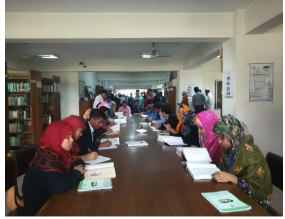
গ্রন্থাগারে পাঠক সেবা