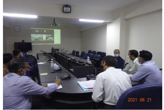
অবহিতকরণ সভা, জাতীয় কবি কাজী নজরুল বিশ্ববিদ্যালয়, ময়মনসিংহ

ব্যান্ডকের সেবা/কার্যক্রমসমূহ বহুল প্রচারের লক্ষ্যে দেশের বিভিন্ন সরকারি বিশ্ববিদ্যালয়, মেডিক্যাল কলেজ এবং বিভিন্ন গবেষণা প্রতিষ্ঠানে ১১ টি সেমিনার/কর্মশালা/অবহিতকরণ সভা অনুষ্ঠিত হয়েছে।