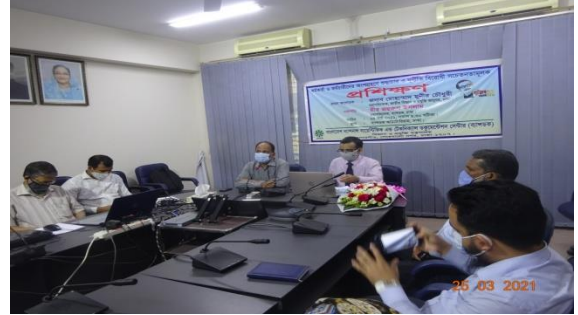
জাতীয় শুদ্ধাচার কৌশল বাস্তবায়ন সংক্রান্ত প্রশিক্ষণ

ব্যান্ডকের আবশ্যিক কৌশলগত উদ্দেশ্যসমূহ বাস্তবায়নের লক্ষ্যে নৈতিকতা কমিটির সভা, শুদ্ধাচার সংক্রান্ত প্রশিক্ষণ/কর্মশালা এবং অংশীজনের অংশগ্রহণে বেশ কয়েকটি সভা অনুষ্ঠিত হয়েছে।