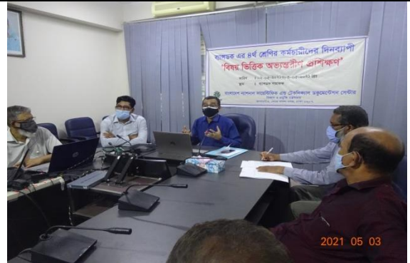
বিষয়ভিত্তিক অভ্যন্তরীণ প্রশিক্ষণ

কর্মকর্তা/কর্মচারীদের দক্ষতা বৃদ্ধির জন্য প্রত্যেককে ৬০ জনঘন্টা বিষয়ভিত্তিক প্রশিক্ষণ প্রদান করা হয়েছে।