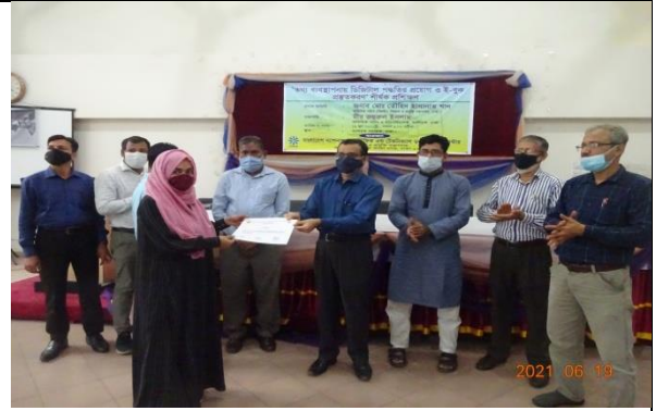
ই-বুক প্রস্তুতকরণ প্রশিক্ষণ

তথ্য ব্যবস্থাপনায় ডিজিটাল পদ্ধতি প্রয়োগের অংশ হিসেবে দেশের বিভিন্ন আরঅ্যাডডি প্রতিষ্ঠান ও বিশ্ববিদ্যালয়সমূহের গ্রন্থাগারিক ও গ্রন্থাগার সংশ্লিষ্ট কর্মকর্তাদের অংশগ্রহণে ০৬টি ই-বুক প্রস্তুতকরণ প্রশিক্ষণ অনুষ্ঠিত হয়েছে।