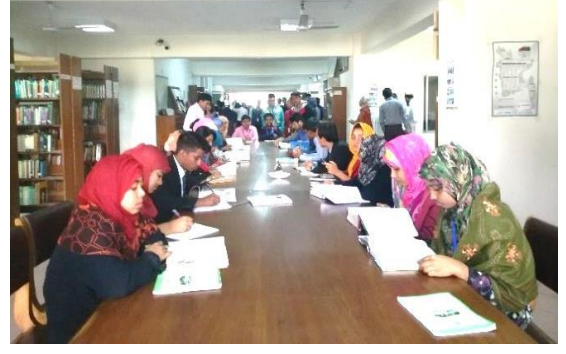
গ্রন্থাগারে পাঠক সেবা